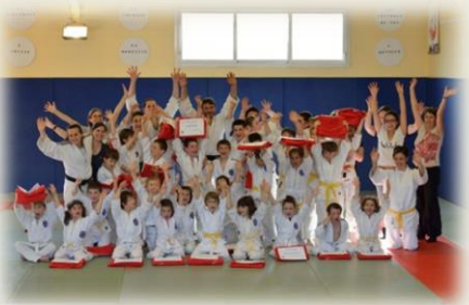
Stage de Judo : Remise des Diplômes