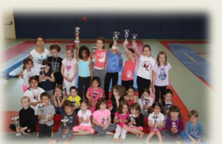
Interclubs Gym-enfants - Mai 2015