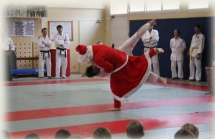
Arbre de Noël : Décembre 2014