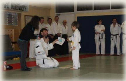
Soirée Crêpes : Concours de dessin - Février 2015