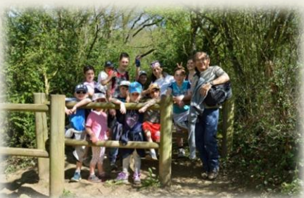
Stage de Judo : Jeu de piste - Avril 2015