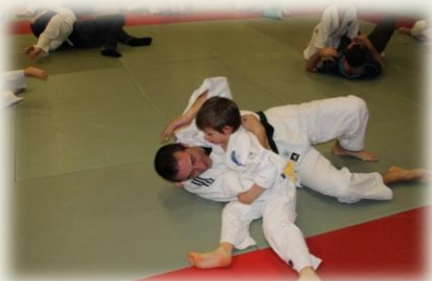
Soirée Crêpes : Randori enfant-adulte/parent